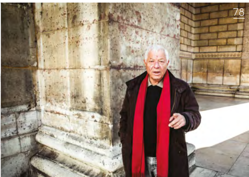
Place de l'église Allô cathos?