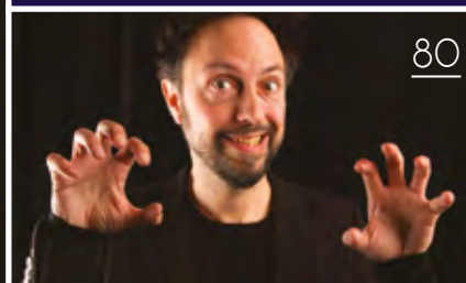
Andreï Nekrasov La guerre froide est de retour